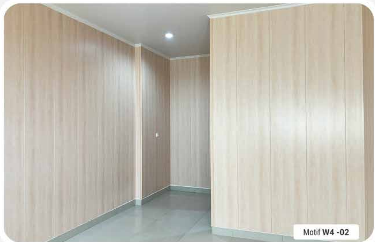
Motif W4 -02