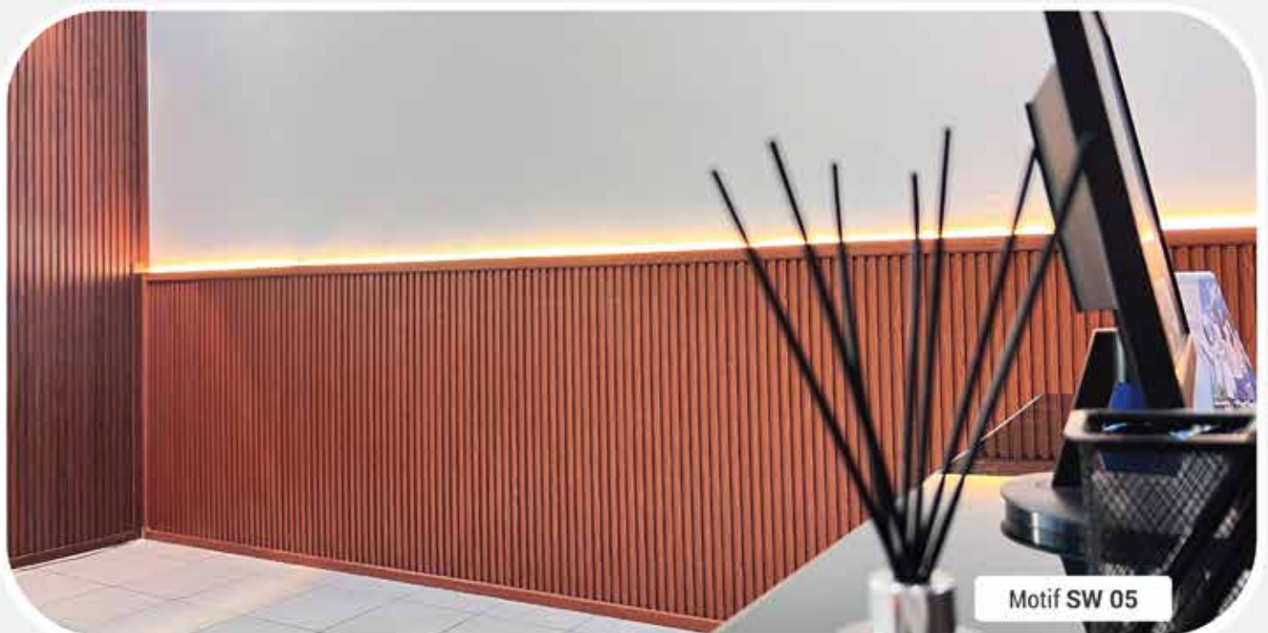
Motif SW 05