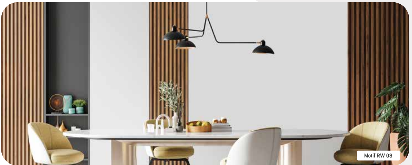
Motif RW 03